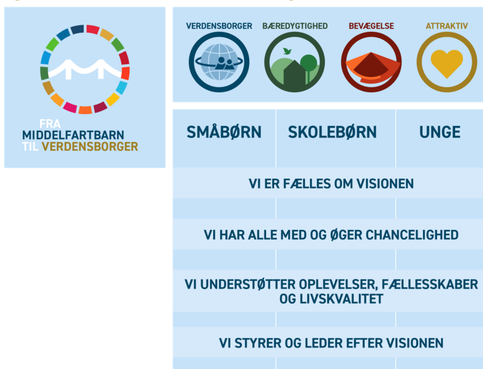
Figur 1: Fra Middelfartbarn til Verdensborger - samlet vision

Visionen "Fra Middelfartbarn til Verdensborger" er et udtryk for, hvad vi drømmer om, at ethvert barn og enhver ung, der er opvokset i Middelfart Kommune tager med sig i rygsækken, når han eller hun skal videre i voksenlivet. Det handler med andre ord om, hvilke værdier og fortællinger, som vi ønsker, at et Middelfartbarn skal kende og kunne kendes på af andre i verden – såvel lokalt, nationalt som globalt.