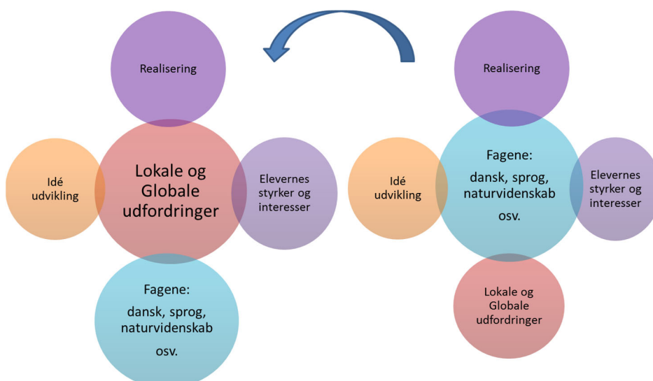
Figur 2: Den innovative undervisningsmodel