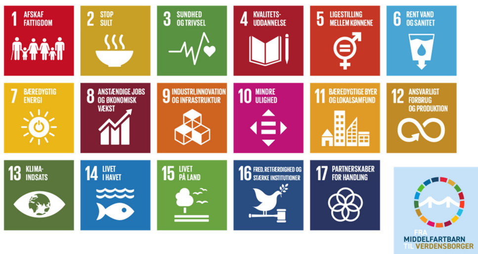
Figur 4: FN's 17 Verdensmål